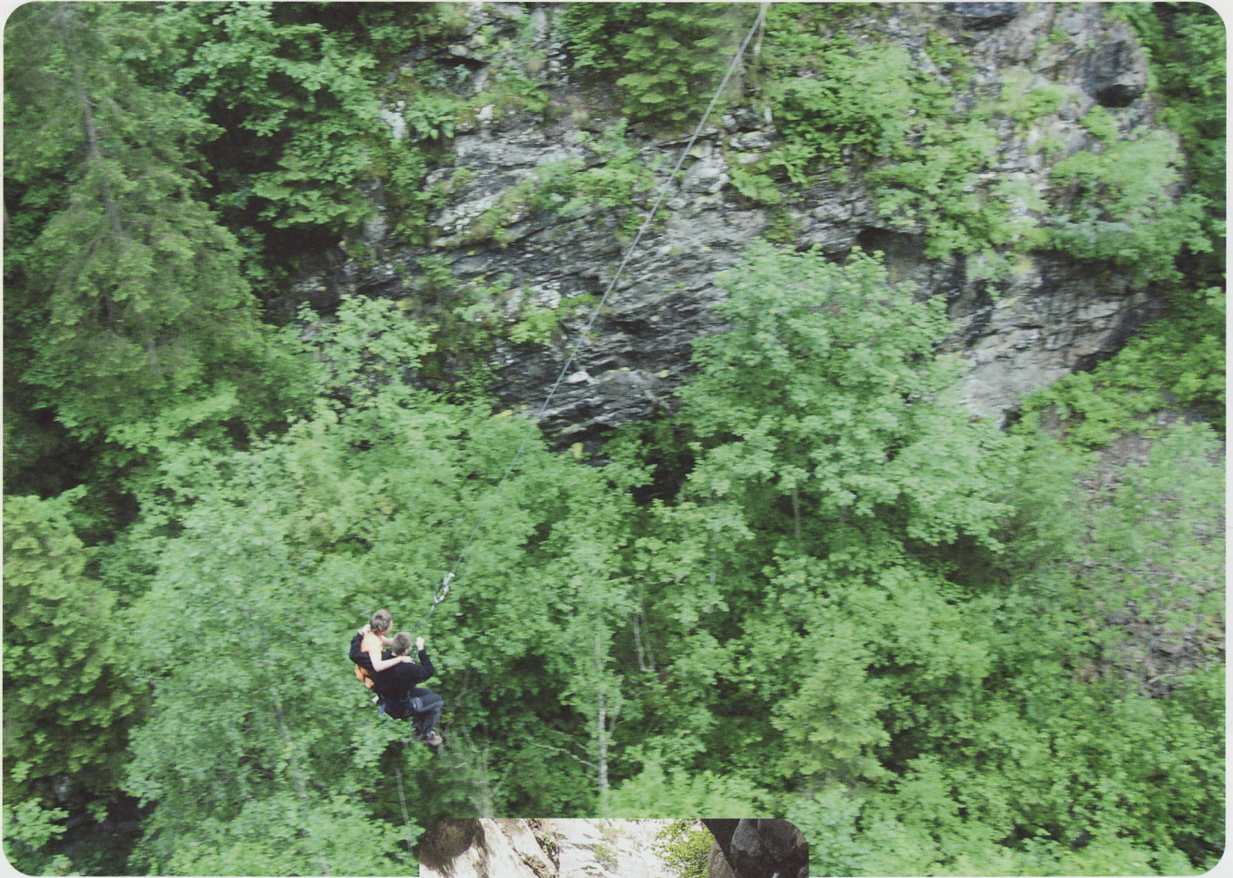
«Not my day, should have slept longer, but I made it»