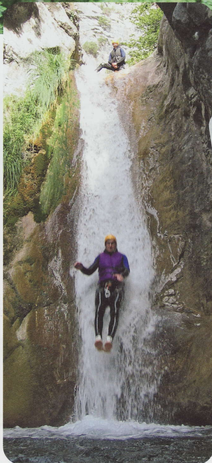
«A chance to challenge myself (specially before the girls)»