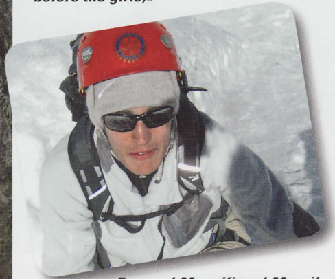
«Enorme! Magnifique! Merci!»